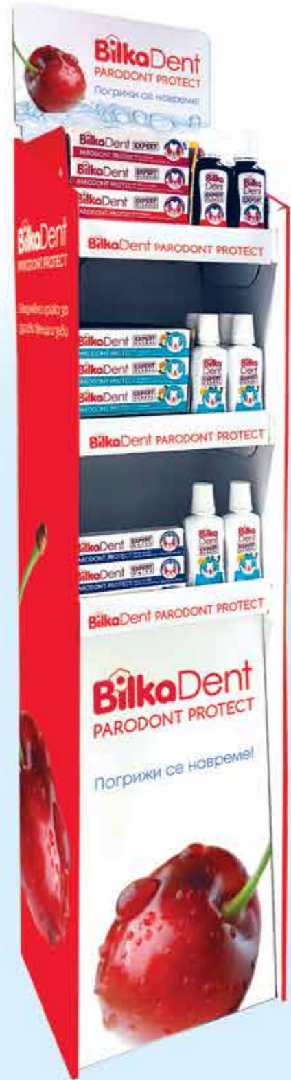
Cartoon shelving 3 levels 34 x 25 x 158 cm