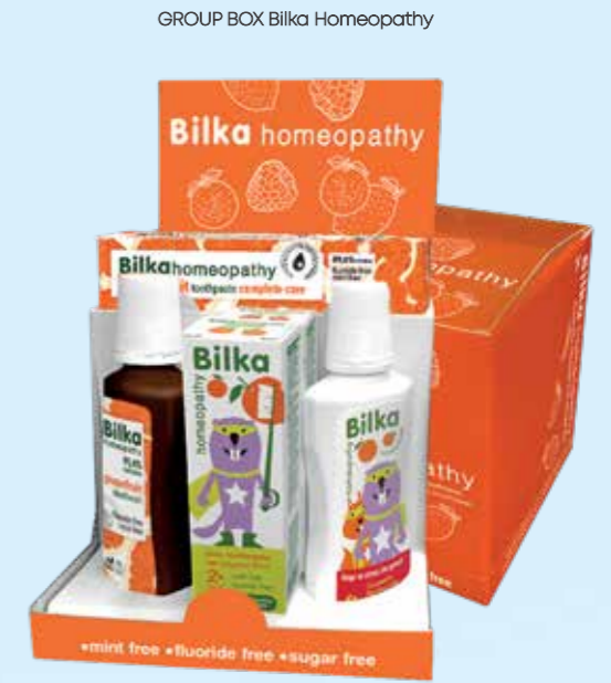
GROUP BOX Bilka Homeopathy