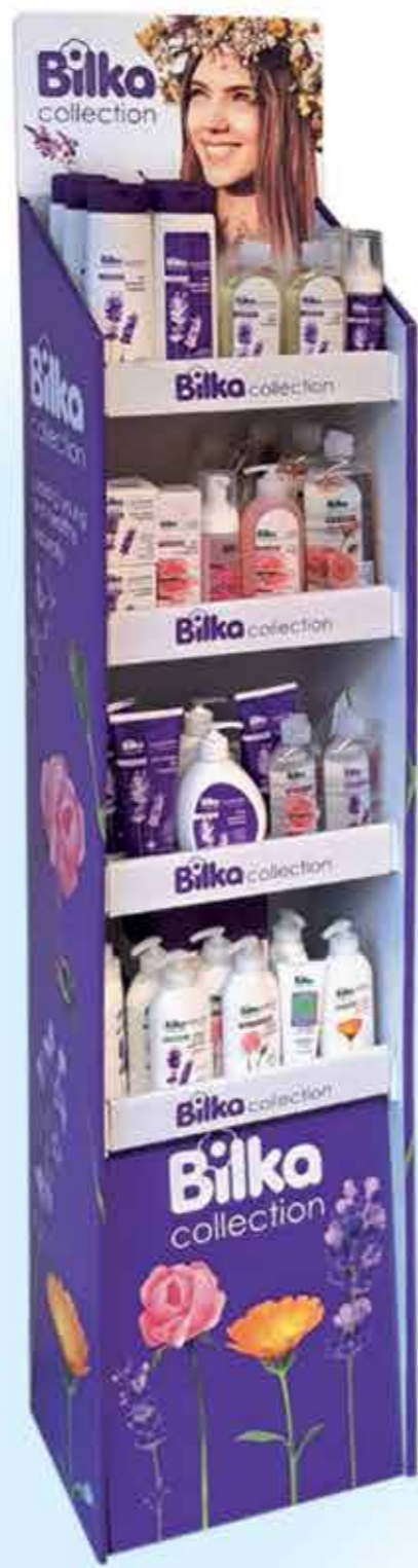
Cartoon shelving 4 levels 34 x 25 x 158 cm