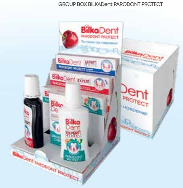
GROUP BOX BILKA Dent PARODONT PROTECT