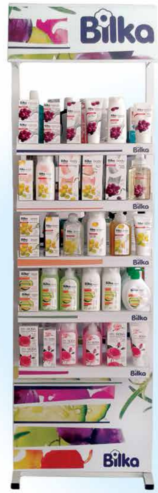
Metal shelving 4 levels 44 x 25 x 150 cm